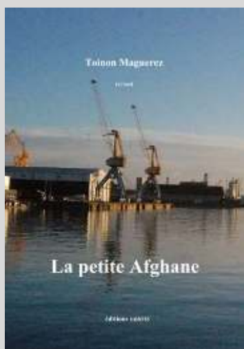
La petite Afghane