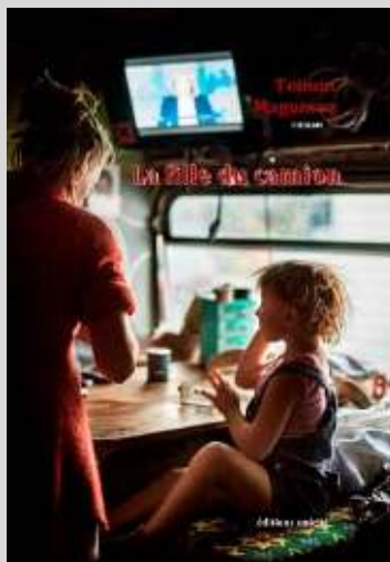
La fille du camion